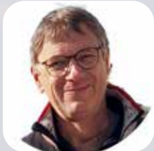
Karsten Schwarze Impressed GmbH